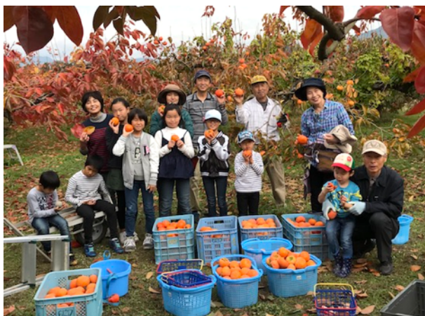
一昨年の収穫体験会にて